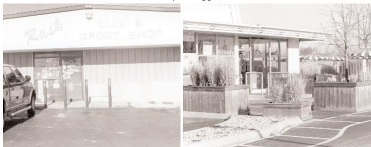
A instalação de pilares, postes ou vasos com plantas na frente das portas das lojas ajuda a prevenir os assaltantes de arrombarem as portas com viaturas.

Como já foi mencionado, as evidências provenientes dos estudos realizados, no tocante ao valor daquelas medidas, são indistintas e inconsistentes. Os assaltantes costumam dizer que acham que aquelas medidas são um pequeno obstáculo à sua ação e, do ponto de vista da polícia, elas poderão resultar em pequenos benefícios se, meramente, deslocalizarem os assaltos para outras lojas. As autarquias locais poderão resistir a autorizar algumas daquelas medidas, nomeadamente quando se tratam de persianas metálicas e de iluminação de segurança, uma vez que poderão tornar uma área menos atrativa. 27