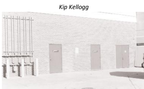
Os inquéritos locais às lojas deverão incluir uma avaliação da vigilância natural, da iluminação e da segurança das entradas das traseiras da loja.