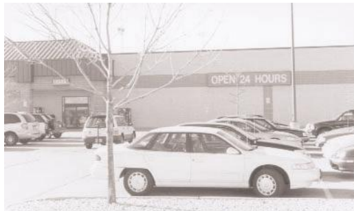
As lojas que trabalham 24 horas por dia estão protegidas dos assaltos devido à presença constante do pessoal.